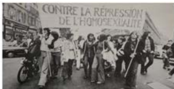
Manifestation du GLH (Groupe de libération homosexuel) Politique et quotidien en juin 1977. L'Express, 23 janvier 1978