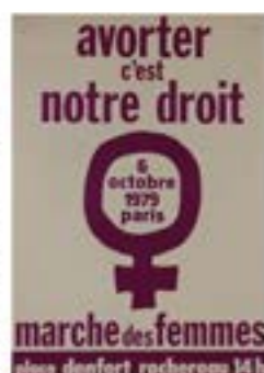
Affiche pour un appel à manifester Paris, 6 octobre 1975