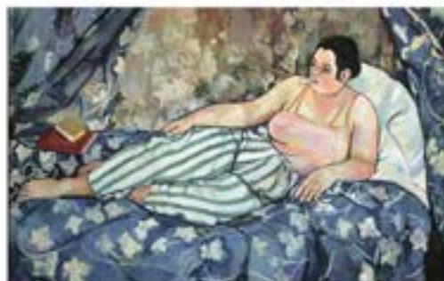
Suzanne Valadon, « La Chambre bleue », 1923