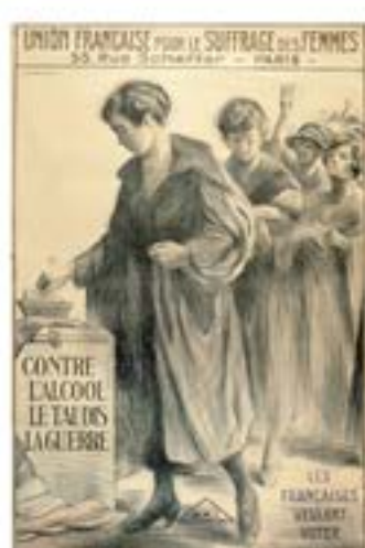
« Les Françaises veulent voter » Dessinateur Chouvenet