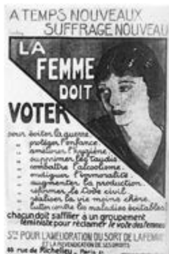
Affiche éditée par « La Société pour l'amélioration du sort de la femme et la revendication de ses droits », en 1921.

Ce mouvement, incarné par l'Union sociale et politique des femmes (WSPU) et sa figure de proue, Emmeline Pankhurst, s'est distingué des méthodes plus pacifiques des suffragistes par le recours à la désobéissance civile, aux manifestations violentes, aux actes de vandalisme (fenêtres brisées, incendies) et aux grèves de la faim en prison, dans le but d'attirer l'attention médiatique et politique.