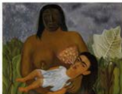
Ma nourrice et moi, Frida Kahlo (1937)