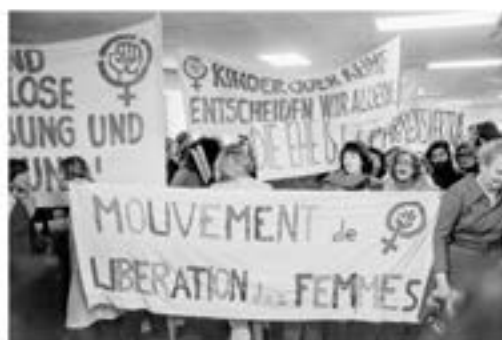
Le 26 août 1970, le Mouvement de libération des femmes fait le jour à Paris