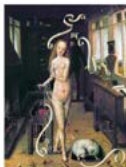
Le corps féminin est assimilé à la tentation. Parfois, on sous-entend même qu'une magie s'y agit. Le philare d'amour, Maître du Bas-Rhin, XV e siècle.