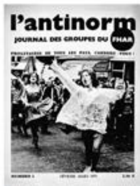
L'Antinorm, journal du Front Homosexuel d'Action Révolutionnaire (juin-mars 1973)