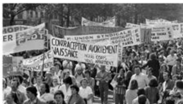
Des femmes, portant une banderole pour la contraception, l'avortement et le contrôle des naissances, lors d'une manifestation à Paris le 24 mai 1971 (photo d'illustration).