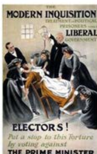
Affiche réalisée par « A Patriot », représentant une suffragette emprisonnée soumise au gavage forcé, 1910.