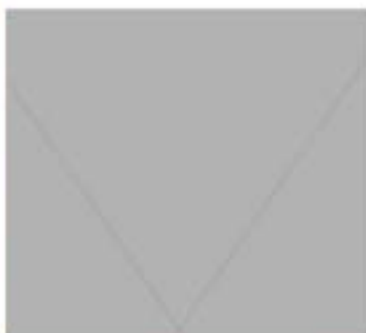
Blanc dans le lit conjugal, il fallait se méfier des guisones démoniaques, raison pour laquelle la théologie imposait des règles strictes en matière de rapports conjugaux.