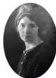
Margaret Sanger (1879-1966)

En France, il faut attendre la création de la « Maternité heureuse », fondée dans la quasi-clandestinité en 1956 par des protestantes, notamment issues du Mouvement Jeunes Femmes.