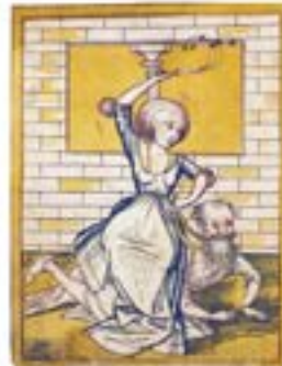
Arzote et Phyllis dans un manuscrit, vers 1480-1520.