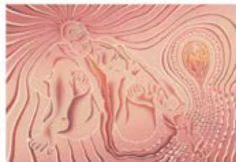
Birth Year/Year, Judy Chicago (1985)

Pendant des siècles, le corps de la femme a été utilisé pour incarner des concepts abstraits : la beauté, la nature, ou la mythologie. Dans la peinture classique, le nu féminin répondait souvent aux codes du « male gaze » (regard masculin), où la femme est une figure passive, offerte au regard du spectateur.