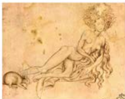
L'Allegorie de la luxure de Pisanello (vers 1425) est incarnée par une femme.

Les manuels de confesseurs établissent des listes détaillées de « péchés charnels » : positions sexuelles, fréquence des rapports, pensées impures. Le confessionnal devient le lieu d'interrogatoire de l'intimité féminine.