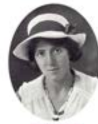
Marie Stopes (1879-1960)